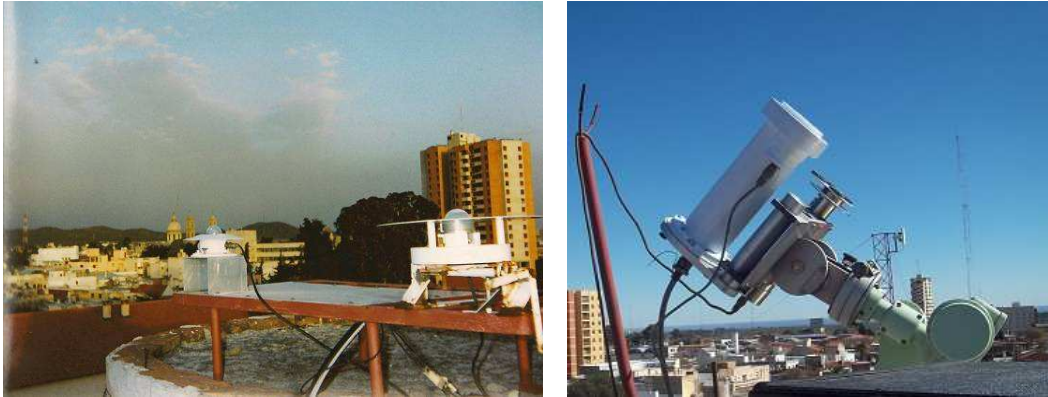
Figura 1. Vista de los sensores utilizados (piranómetros, izquierda, y pirheliómetro de incidencia normal, derecha) y su ubicación sobre el techo del Laboratorio de Energía Solar en la ciudad de San Luis.

Este último montado sobre un seguidor solar que rota 360° en 24 horas. La declinación solar se ajustó manualmente cada día. Una vez por año, ambos sensores fueron calibrados mediante el empleo de un pirheliómetro absoluto de cavidad, conforme procedimientos recomendados por diversos autores, Grossi Gallegos (2002).